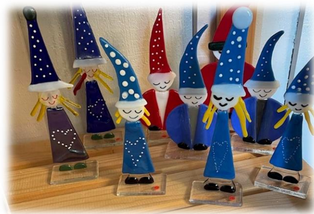
Glasskunst av Goro Foss-Haneborg